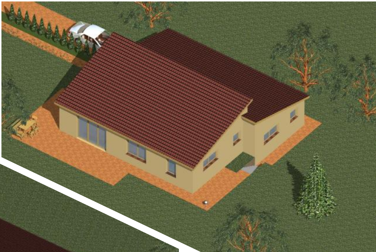
KADAŇ - LOKALITA STRÁŽIŠTĚ III., rodinný dům typ 1